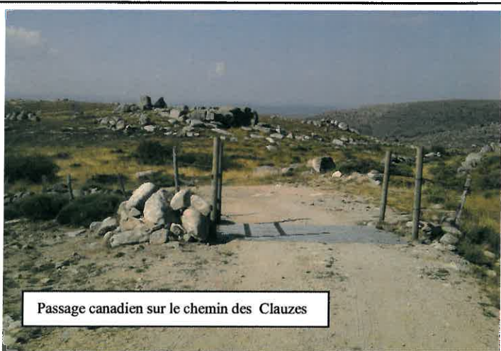
Passage canadien sur le chemin des Clauzes

L'année 2012 aura connu de nombreux travaux dans notre commune: mise en souterrain des réseaux secs à Finialettes avec reprise du pluvial et des égouts*, mise en souterrain des réseaux EDF, moyenne tension entre le Col du pont sans eau et le Pont de Montvert, pose de passages canadiens sur le chemin des Clauzes, modernisation de l'éclairage public sur Plaisance et Bellevue, construction d'un mur de soutènement sur la route du Viala, aménagement du chemin de Mallebrière, restauration du logement communal au dessus de la mairie. D'autres sont en cours : transformation de la maison de « Marie » à Fraissinet en résidence d'entrepreneurs, aménagement du chemin du parking de la cascade vers les bois à Runes, aménagement de la RD 35 entre Fraissinet et Pont Runès,... D'autres sont engagés pour 2013 : station d'épuration de Fraissinet, goudronnage du chemin rural de la Brousse aux Clauzes et de la route de Racoules, aménagement de la route de Finialettes, mise en place des périmètres de protection des 4 captages d'eau potable, mise en souterrain des réseaux EDF, moyenne tension entre Pont sans eau et Finialettes, Fraissinet, Runes, Ruas vers Miral.