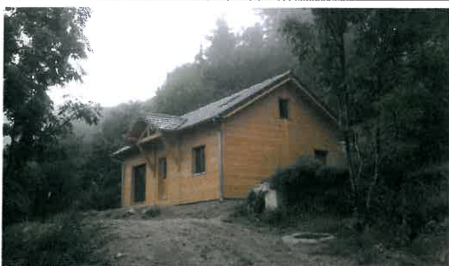
Maison au Viala très bien intégrée au paysage

Le bureau d'études Synergie et le COPAGE ont effectué la première étape du PLU : le diagnostic communal. Il a été présenté et validé par le comité de pilotage. La deuxième étape, le PADD (Projet d'Aménagement et de Développement Durable) qui précise les orientations du développement communal est en cours. La troisième étape consistera à élaborer le zonage et les règles de constructibilité dans les différentes zones.